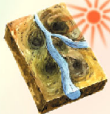
আলো, তাপ ও পানির সমন্বয়