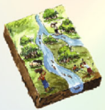
মানুষের আবির্ভাব ও সম্পদ আহরণ