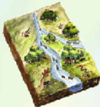
প্রাণের সমন্বয় ও সম্পদ সৃষ্টি