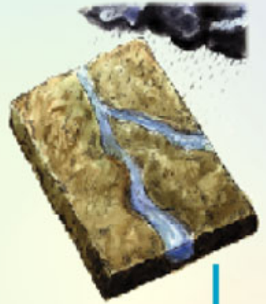
ভূমিতে পানির প্রবেশ